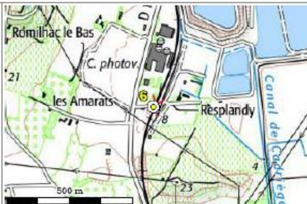
Carte : 2545 BEZIERS