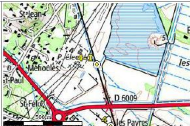
Carte : 2546 NARBONNE