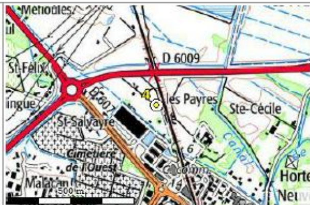
Carte : 2546 NARBONNE